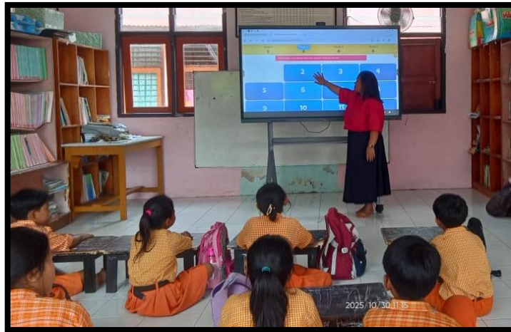
Gambar 1. Siswa mengikuti kuis Baamboozle secara berkelompok di kelas