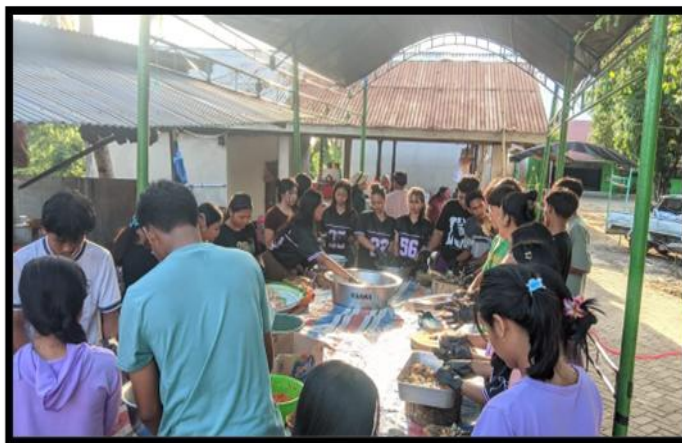
Gambar 1. Proses memasak bersama oleh siswa rantau

Siswa siswi baru yang berasal dari desa untuk melanjutkan pendidikan di sekolah perkotaan sudah tentunya memiliki persepsi yang berbeda (Lawrence et al., 2024). Tentu saja hal ini menjadi salah satu tekanan tersendiri yang dimiliki setiap individu. Ditambah dengan sistem sekolah yang mewajibkan seluruh siswanya untuk berasrama ( boarding school ).