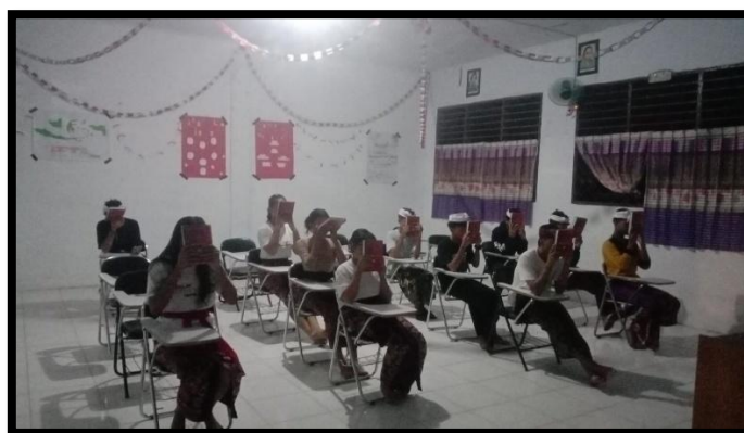
Gambar 2. Sembahyang pagi dan pembacaan kitab suci yang dilakukan setiap pukul 4 pagi

Siswa perantauan akan dihadapkan dengan teman-teman yang berbeda dengan lingkungan awal dari siswa perantauan. Seperti yang dialami oleh siswa perantauan yang pernah merasakan tidak tahan dengan kondisi lingkungan asrama dan juga latar budaya dan juga gaya bahasa yang berbeda sehingga merasa tidak tahan diasrama (berdasarkan hasil wawancara). Namun seiring siswa tersebut mengikuti dan juga saling mencari informasi kondisi asrama tersebut serta mengenali teman-teman mereka, maka hal tersebut dapat diatasi. Konsep diri yang memberikan sebuah cara pandang siswa perantauan untuk beradaptasi dengan mengetahui isi lingkungan dan latar belakang teman-teman siswa yang lain agar dapat diakui oleh sesama siswa tersebut. konsep diri menjadikan siswa dapat mengontrol kecemasan mereka karena dapat menerima lingkungan barunya dikarenakan dapat memprediksi dan memperhatikan keadaan serta melihat perilaku teman-teman siswanya secara keseluruhan.