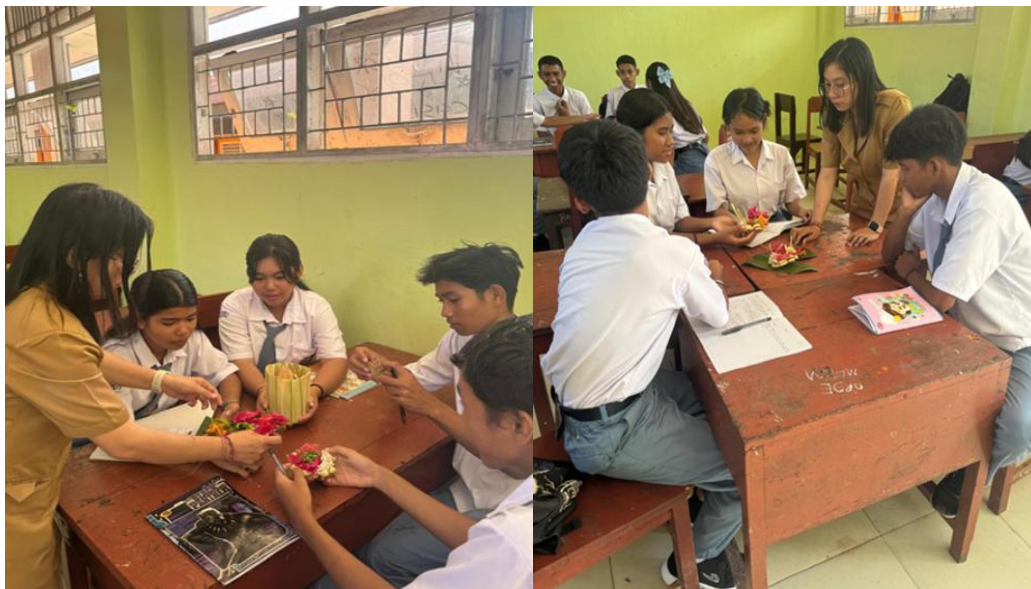
Gambar 2 & 3. Praktik sarana Upakara

Secara umum, hasil ini merefleksikan bahwa pelibatan langsung siswa dalam praktik keagamaan khususnya dalam pembuatan banten daksina tidak hanya meningkatkan aspek pengetahuan, tetapi juga memperkuat pengalaman spiritual, pemaknaan terhadap simbol-simbol religius, serta membentuk sikap religius dan tanggung jawab yang lebih dalam terhadap warisan budaya Hindu. Kegiatan pendampingan terbukti menjadi media transformatif dalam mentransfer nilai-nilai agama secara kontekstual dan menyeluruh, sekaligus menjembatani kesenjangan antara pembelajaran teoritis dengan praktik budaya keagamaan yang otentik.