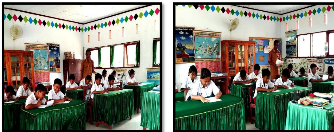
Gambar 1 & 2. Siswa sangat antusias melaksanakan pembelajaran

Selain observasi, pada data dokumentasi siswa terlihat sangat serius dan menyenangkan dalam menerima pembelajaran yang diberikan oleh guru. Seluruh siswa membaca buku pada inti kegiatan belajar mengajar untuk dapat menjawab pertanyaan satu persatu yang diberikan oleh guru pendidikan agama Hindu.