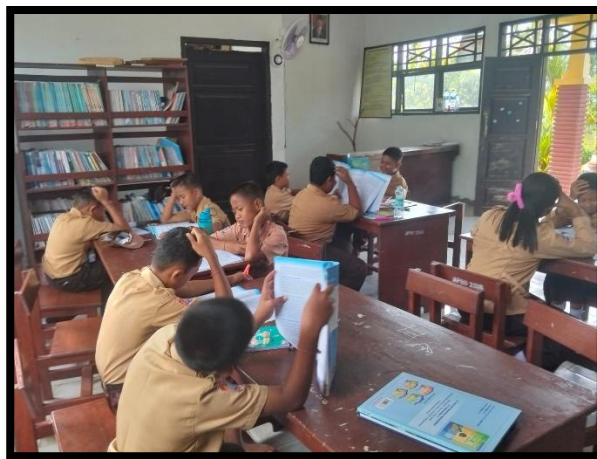
Gambar 1. Membaca materi Panca Yajna pada siklus I

Setelah pelaksanaan tindakan pada siklus I, yaitu penerapan strategi Gerakan Literasi Sekolah dengan media bacaan bergambar dan cerita kontekstual Hindu, terjadi peningkatan nilai rata-rata minat baca menjadi 73,3, yang tergolong dalam kategori “baik”. Namun, hasil observasi menunjukkan bahwa sebagian siswa masih pasif dan belum terlibat aktif dalam diskusi pasca-membaca. Oleh karena itu, dilakukan penyempurnaan pada siklus II, seperti penambahan pojok baca tematik Hindu dan pemberian tugas kreatif berbasis bacaan (poster Panca Yajna dan booklet mini cerita yajna).