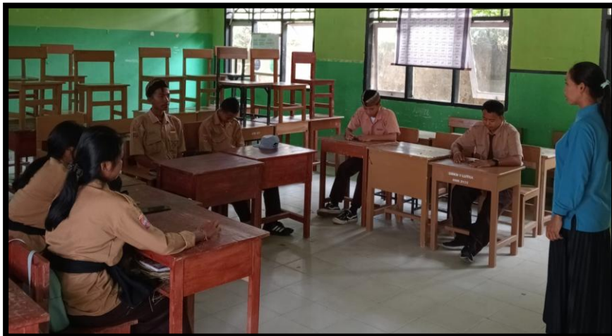
Gambar 2. Siswa merenung setelah memainkan peran dan menggali nilai-nilai yang terkandung dalam cerita Ramayana.

Temuan ini menguatkan hasil-hasil penelitian sebelumnya. Kusuma & Susilo (2020) menyatakan bahwa metode bermain peran meningkatkan keterlibatan siswa karena pembelajaran berlangsung secara langsung, kreatif, dan partisipatif. Hal ini senada dengan temuan Fitriyah & Febyanto (2015) yang menyatakan bahwa melalui bermain peran, siswa tidak hanya belajar secara kognitif tetapi juga secara afektif dan psikomotorik, sehingga seluruh aspek pembelajaran dapat tersentuh. Dalam konteks pembelajaran Pendidikan Agama Hindu, penggunaan cerita Ramayana sebagai sumber nilai memberikan dimensi spiritual dan moral yang lebih mendalam dalam kegiatan bermain peran.