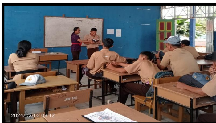
Gambar 1. Aktivitas belajar siswa kurang semangat

Pembelajaran abad ke-21 menekankan pentingnya keterlibatan aktif peserta didik dalam proses belajar melalui pendekatan yang kontekstual, menyenangkan, dan berbasis nilai (Aura et al., 2023; Rønning & Bjørkly, 2019). Dalam konteks Pendidikan Agama Hindu, integrasi antara metode pembelajaran aktif dengan penggalian nilai-nilai spiritual dari epos seperti Ramayana menjadi sangat relevan. Berbagai penelitian mutakhir, seperti Mahadewi (2023) dan Permana (2021), menunjukkan bahwa cerita-cerita dalam Ramayana tidak hanya mengandung nilai-nilai susila dan kepemimpinan, tetapi juga dapat menjadi sarana efektif dalam membentuk karakter dan kesadaran etis peserta didik jika disampaikan melalui pendekatan yang partisipatif. Salah satu pendekatan tersebut adalah metode bermain peran ( role playing ), yang terbukti mampu meningkatkan aktivitas belajar dan pemahaman nilai (Alfianto et al., 2013; Ariputra, 2024; Fitriyah & Febyanto, 2015; Kusuma & Susilo, 2020; Vizeshfar et al., 2019; Winardy & Septiana, 2023).