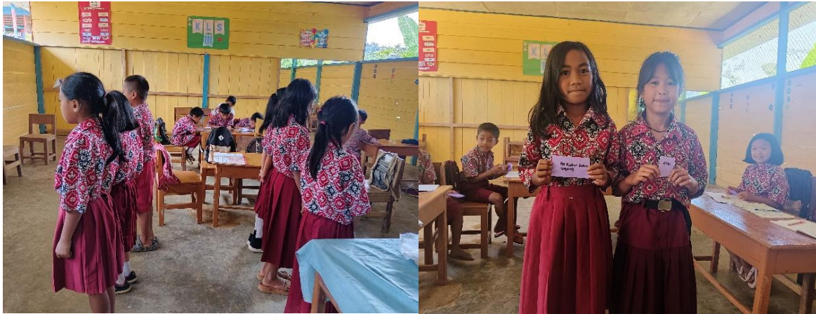
Gambar 2 & 3. Siswa Memainkan dan memasang jawaban yang sesuai.

Temuan ini sejalan dengan hasil-hasil penelitian terdahulu yang menunjukkan bahwa model Make a Match efektif dalam meningkatkan hasil belajar dan motivasi (Suprpta, 2020; Riyanti & Abdullah, 2018; Wijendra, 2020). Namun, penelitian ini memiliki keunikan karena diterapkan pada konteks Pendidikan Agama Hindu, sebuah bidang yang masih jarang disentuh dalam inovasi pembelajaran berbasis model kooperatif. Oleh karena itu, hasil ini memperkuat argumentasi bahwa model pembelajaran aktif dan kolaboratif dapat diterapkan lintas bidang studi, termasuk dalam pendidikan nilai-nilai spiritual.