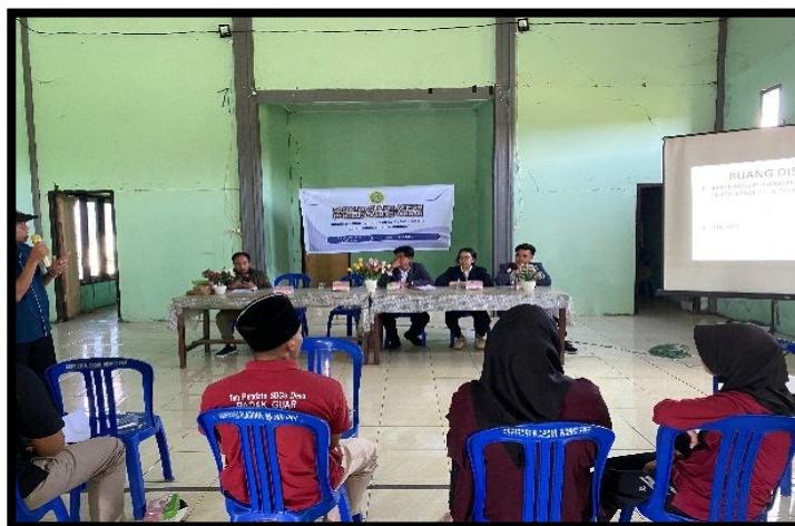
Gambar 2. Pemberian materi tentang sosialisasi pengelolaan keuangan.

dan memanfaatkan pinjaman dengan bijak. Masyarakat sangat antusias selama kegiatan. Mereka menunjukkan minat yang besar dalam belajar dan mendengarkan dengan teliti. Mereka dapat berkonsultasi tentang masalah keuangan mereka melalui diskusi interaktif dan sesi tanya jawab. Materi yang disampaikan dapat dengan mudah dipahami dan langsung diterapkan dalam karena narasumber memberikan solusi praktis dan contoh kasus yang relevan.