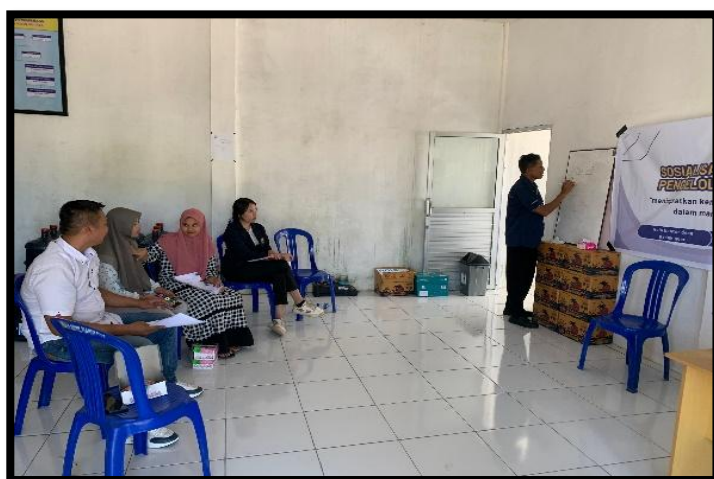
Gambar 3. Pelatihan tentang pentingnya pengelolaan keuangan

Hasil dari kegiatan sosialisasi ini menunjukkan bahwa orang-orang di Desa Padak Guar sangat ingin belajar bagaimana mengelola keuangan. Mereka menunjukkan keinginan yang besar untuk belajar lebih banyak dan menggunakan pengetahuan yang mereka peroleh untuk memperbaiki kondisi keuangan mereka di masa depan. Kegiatan ini diharapkan akan mengajarkan masyarakat bagaimana mengelola keuangan mereka dengan lebih baik, sehingga mereka dapat hidup lebih baik dan menghindari kemiskinan.