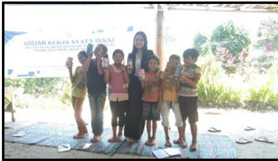
Gambar3. Pembagian celengan

Materi yang diberikan pada pertemuan berikutnya yaitu pendalaman mengenai kebutuhan dan keinginan serta pemberian materi mengenai pengelolaan dan penggunaan uang untuk anak-anak. Disini penulis memberikan tips kepada peserta dalam menggunakan uangnya. Adapun tips yang diberikan adalah mengeluarkan uang untuk kebutuhan sehari-hari yang mana lebih mengutamakan memenuhi kebutuhan dibandingkan keinginan, dan memberikan tips untuk hidup hemat dan rajin menabung untuk memenuhi tujuan hidup dan tujuan keuangannya.