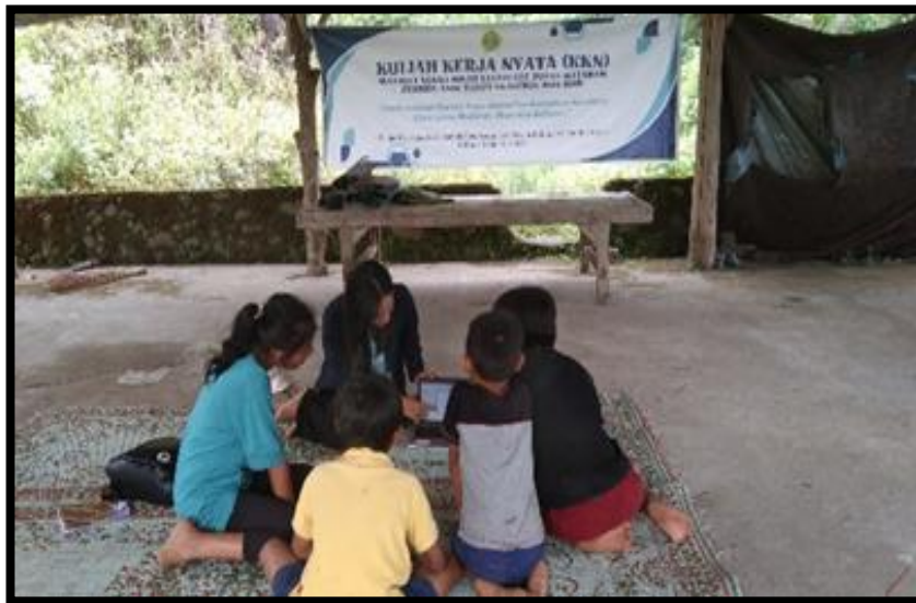
Gambar 1. Sosialisasi literasi keuangan

terhadap kesejahteraan finansial seseorang Fenomena ini terlihat dari penelitian yang dilakukan oleh Chen dan Volpe (1998) yang mengungkapkan bahwa seorang generasi muda yang memiliki pemahaman terbatas mengenai masalah keuangan lebih rentan untuk memiliki keyakinan yang salah tentang uang dan melakukan kesalahan dalam mengambil pilihan keuangan. Oleh karena itu, penelitian ini menunjukkan pentingnya memberikan literasi keuangan kepada generasi muda sedini mungkin.