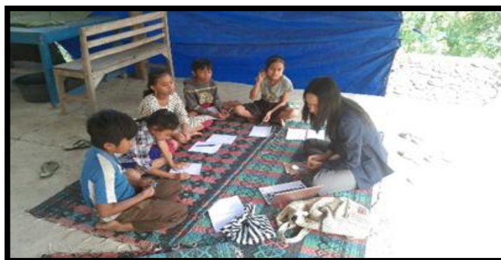
Gambar 2. Penyampaian materi

Program Kerja Sosialisasi Literasi keuangan ini diawali dengan pemberian materi dasar mengenai pengertian uang, pada pertemuan pertama, kemudian pada pertemuan berikutnya diberikan materi mengenai pengenalan kebutuhan dan keinginan, Dalam pemberian materi mengenai literasi keuangan dapat dikatakan mudah dipahami oleh anak-anak karena dalam penyampaian disampaikan secara sederhana dan mudah untuk dipahami.