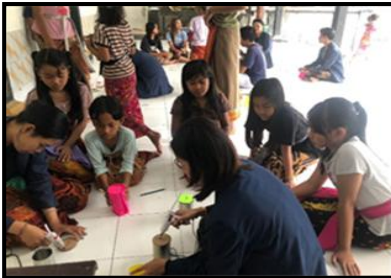
Gambar 3.Praktik pembuatan celengan

warna,cutter berguna melubangi kardus dan lem berguna untuk menempelkan kain flannel pada kaleng. Pelatihan menggunakan bahan bekas ini bertujuan agar anak – anak dapat memanfaatkan barang – barang yang tidak terpakai di sekitarnya.