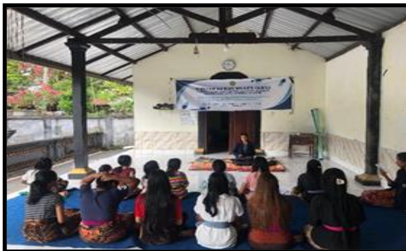
Gambar 2. Pemaparan materi

dusun banjar metu, desa mantang, kecamatan batukliang, Lombok tengah.berikut adalah kegiatan yang dilaksanakan