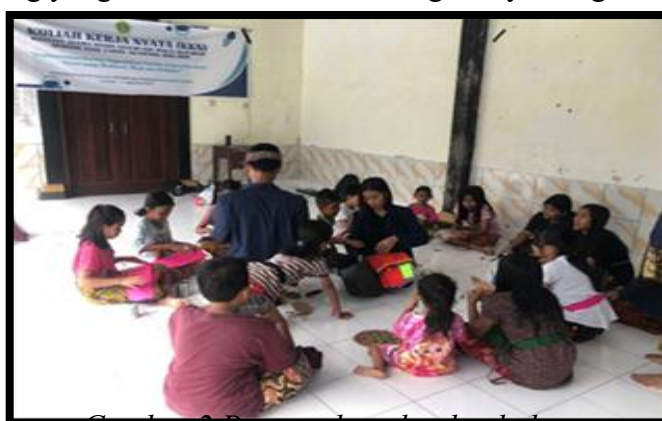
Gambar 2.1.Pengenalan alat dan bahan

Pelatihan ini diawali dengan pemberian materi dasar tentang pengertian menabung, pentingnya menabung, tujuan menabung, dan cara memanfaatkan barang bekas menjadi produk dengan penyampaian materi menggunakan Bahasa yang mudah dipahami oleh anak – anak dusun banjar metu. Saat menyampaikan materi saya menggunakan power point untuk membantu menyusun agenda. Tujuan dari kegiatan ini adalah agar anak – anak memahami pentingnya menabung sejak dini, hal ini sangat membantu dalam mendorong mereka untuk banyak menabung dan dapat membelanjakan uang yang mereka terima dari orang tuanya dengan baik.