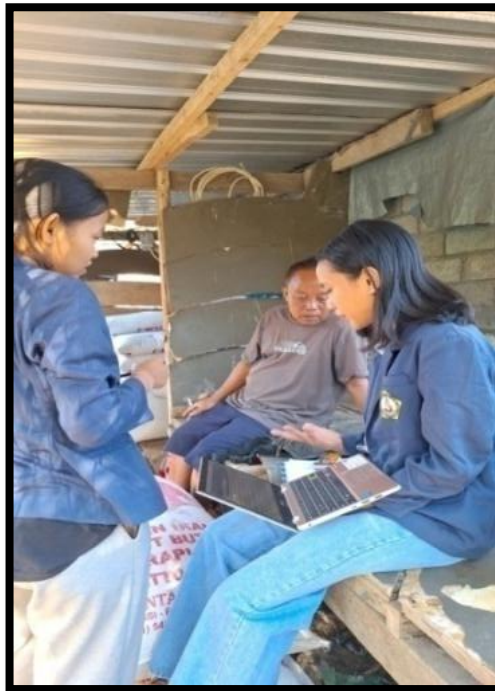
Gambar 2. Keterampilan Membuat Pembukuan Keuangan Sederhana