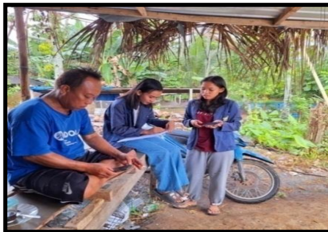
Gambar 1. Pemberian Materi dan Diskusi

Selain itu penulis juga melakukan pembinaan pengelolaan keuangan yang dilakukan dengan mengelompokkan atau mencatat keperluan – keperluan yang akan dibeli untuk keperluan ternak, serta mencatat pendapatan – pendapatan yang diperoleh para peternak di Dusun Taman Bali sehingga peternak mempunyai pencatatan keuangan yang lebih baik dan teratur, setelah memberikan pemahaman mengenai pentingnya mengelola keuangan penulis membuka sesi tanya jawab dan memberikan kesempatan kepada peternak untuk memberikan pendapatnya. Pada saat yang sama, para peternak terlibat dalam percakapan dan sesi tanya jawab untuk mengatasi dan menyelesaikan kendala dan permasalahan yang mereka hadapi. Pada sesi tanya jawab, para peternak menyampaikan pertanyaan tentang tantangan yang mereka hadapi, hal tersebut menunjukkan tingginya semangat mereka untuk terlibat dalam kegiatan yang berfokus pada pertumbuhan pengelolaan keuangan. Kegiatan pembinaan berjalan lancar dan para peternak menunjukkan antusiasme dan penerimaan yang besar terhadap materi pemahaman pengelolaan keuangan selama sesi pembinaan keuangan. Penulis bertujuan untuk membekali para peternak dengan pengetahuan dan kemampuan yang diperlukan dalam pengelolaan keuangan dengan memberikan materi yang relevan.