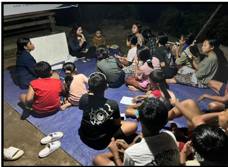
Gambar 2. Penyampaian materi

Program Kerja Sosialisasi Pentingnya Pendidikan dan literasi ini diawali dengan pemberian penjelasan dasar mengenai alasan mereka harus menempuh Pendidikan, kemudian pada pertemuan pertama, diberikan materi mencakup pengertian pendidikan dan literasi, pentingnya pendidikan dan literasi, tujuan serta manfaat pendidikan dan literasi.