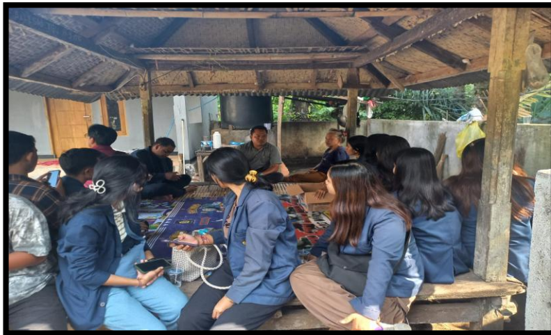
Gambar 1. berinteraksi dengan perangkat desa untuk menggali informasi terkait masyarakat

Program Kerja Sosialisasi Pentingnya Pendidikan dan literasi ini diawali dengan pemberian penjelasan dasar mengenai alasan mereka harus menempuh Pendidikan, kemudian pada pertemuan pertama, diberikan materi mencakup pengertian pendidikan dan literasi, pentingnya pendidikan dan literasi, tujuan serta manfaat pendidikan dan literasi.