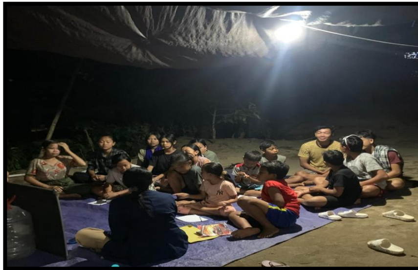
Gambar 3. Tahap evaluasi

memungkinkan mereka untuk menggali informasi lebih lanjut sesuai dengan minat masing-masing.