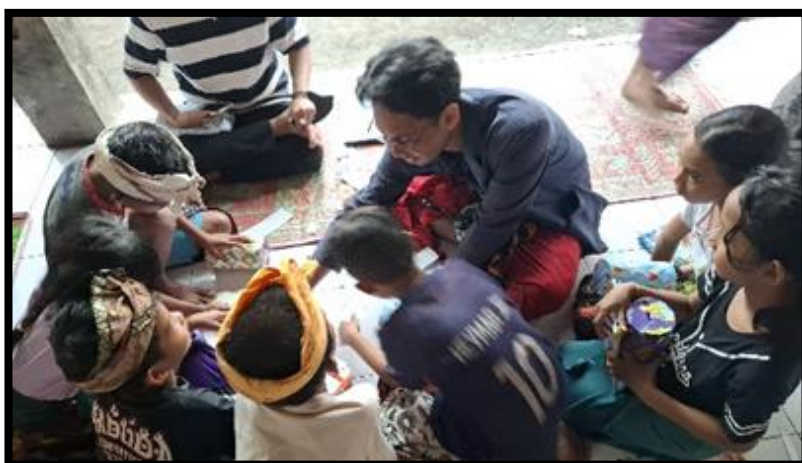
Gambar 3 : praktek pembuatan tabel menabung.

Program kedua yang dijalankan berupa pemberian materi tentang sistematika sistem menabung secara sederhana namun efektif dan mudah diterapkan oleh anak-anak sejak dini. Penggambaran sistem menabung sederhana berupa penggunaan tabel menabung yang di coret setiap kali menabung dengan nominal tertentu sesuai yang sudah tertera pada tabel. Program ketiga adalah praktik penerapan tabel menabung yang dilakukan oleh anak-anak Dusun Ubung. Tabel menabung yang akan digunakan berisi nominal yang bisa dijangkau oleh anak-anak Dusun Ubung sesuai hasil observasi. Untuk nominal target yang akan dicapai, mereka bebas memilih sesuai keinginan masing-masing. Tabel menabung yang sudah mereka buat bisa di tempel di celengan yang sudah mereka buat.