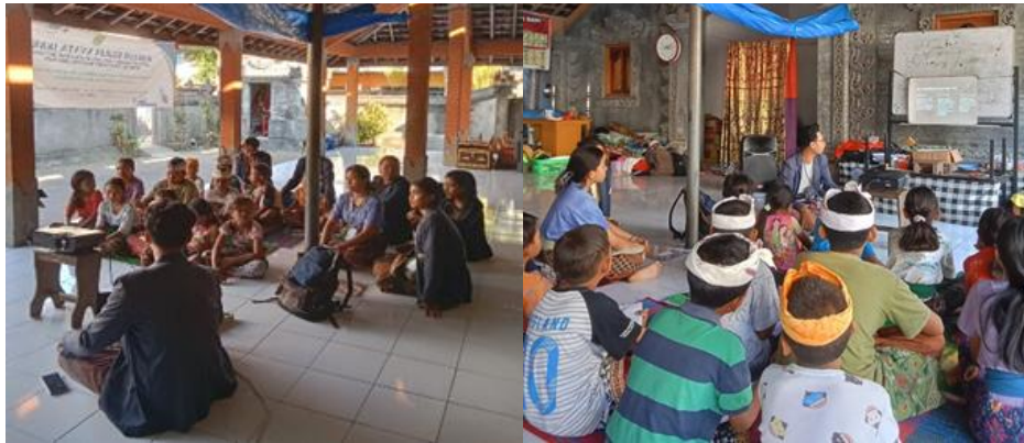
Gambar 2: pemaparan materi tentang pengelolaan keuangan sejak dini.

Program kedua yang dijalankan berupa pemberian materi tentang sistematika sistem menabung secara sederhana namun efektif dan mudah diterapkan oleh anak-anak sejak dini. Penggambaran sistem menabung sederhana berupa penggunaan tabel menabung yang di coret setiap kali menabung dengan nominal tertentu sesuai yang sudah tertera pada tabel. Program ketiga adalah praktik penerapan tabel menabung yang dilakukan oleh anak-anak Dusun Ubung. Tabel menabung yang akan digunakan berisi nominal yang bisa dijangkau oleh anak-anak Dusun Ubung sesuai hasil observasi. Untuk nominal target yang akan dicapai, mereka bebas memilih sesuai keinginan masing-masing. Tabel menabung yang sudah mereka buat bisa di tempel di celengan yang sudah mereka buat.