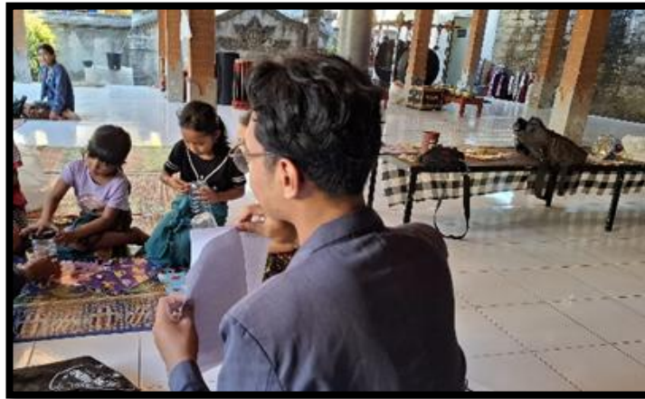
Gambar 4. Pemaparan materi tentang pengenalan sistem menabung sederhana

Mereka juga dapat belajar menetapkan tujuan tabungan yang realistis, seperti menabung untuk mainan atau kegiatan tertentu, yang meningkatkan motivasi dan disiplin dalam menabung. Dengan pemaparan materi ini, anak-anak mengembangkan kebiasaan finansial yang sehat sejak dini, yang akan membantu mereka dalam pengelolaan keuangan pribadi di masa mendatang. Praktek secara langsung dalam penerapan tabel menabung setelah anak-anak mempraktekkannya mereka memperoleh pemahaman yang lebih baik tentang pengelolaan uang. Mereka belajar melihat perkembangan tabungan mereka secara nyata, yang membantu mengembangkan disiplin dan tanggung jawab dalam mengelola uang.